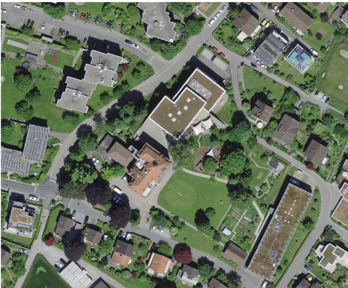
Abb. 1 Projekt-Standort

In Absprache mit der Bildungsdirektion und dem Hochbauamt wurde von Oktober 2024 bis März 2025 eine Machbarkeitsstudie mit vier Standortvarianten durchgeführt. Die HPS entschied sich für die Variante 2 „Aufstockung auf dem niedrigen Gebäudeteil der HPS“. Die gewählte Variante 2 „Aufstockung“ sieht eine Erhöhung des Gebäudes um rund 6 Meter vor. Die Umsetzung gilt baurechtlich grundsätzlich als möglich, unterliegt jedoch den Vorgaben der Bau- und Zonenordnung, insbesondere der Attikaregelung. Mit der neuen Kleinturnhalle soll die bestehende Infrastruktur der HPS nachhaltig gesichert und ein funktionaler Raum für Sport, Bewegung und Therapie geschaffen werden. Die Halle ist integraler Bestandteil des pädagogischen Konzepts der Schule und trägt wesentlich zur Förderung, Gesundheit und sozialen Entwicklung der Schülerinnen und Schüler bei.